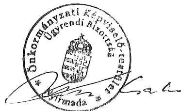
Krivács Csaba Ügyrendi Bizottság elnöke