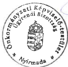
Krivács Csaba Ügyrendi Bizottság elnöke