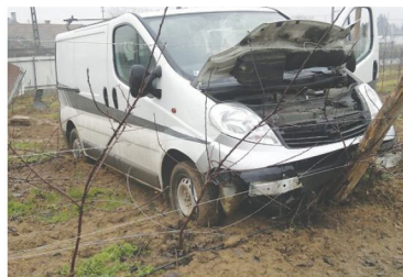
Lesodródott, majd egy kertben állt meg a kisteherautó

Lesodródott az útról, majd egy lakóház kerítését is összetörte, s végül egy kertben állt meg január 21-én egy kisteherautó városunkban, a Kossuth utca egyik lakóházánál. A járműben egy ember megsérült, őt kórházba szállították.