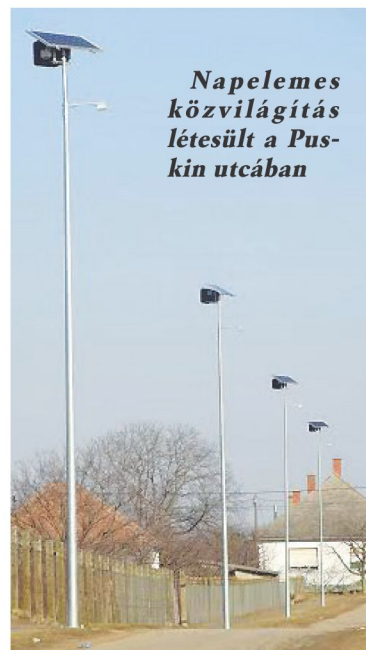
Napelemes közvilágítás létesült a Puskin utcában

3. Nyírmada Biztonságáért bűn- és baleset megelőzési program: