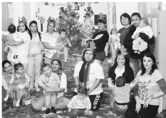
Ünnepi hangulat a Mocorgóban

Az önkormányzat vezetői, a polgármester, az alpolgármester, néhány képviselő és intézményi dolgozó is tiszteletét tette nálunk ezen a rendezvényünkön.