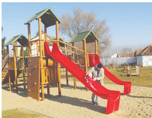
Két játszótér is elkészült, az egyik a Táncsics, a másik az Ady Endre utcában

Az Európai Unió támogatásával két irányban ágazik el a projekt: egyik része az infrastruktúrát (építkezések, felújítások, beszerzések), a másik „lába” az úgynevezett soft (puha) elemeket, az emberi, szociális terület érinti. A kettő természetesen összefügg, egymást erősíti, s ez felel meg az unió elvárásainak is. A programot május 31-ére kell befejezni, s ezt követően június végéig kell elszámolni a felhasznált pénzzel.