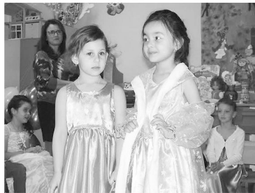
Jól sikerült a farsang

A gyerekek (és persze a felnőttek is) nagy lázban égtek, s készülődtek a télbúcsúztató mulatságra. Kicsik-nagyok szívesen bújtak ezen a napon maskarába, sok vidám verssel, dallal próbálták elzavarni a hideg telet, s persze nem hiányozhattak a vicces versenyek, a táncos mulatozás és a finom torta sem! Természetesen a szülőket, nagyszülőket is szívesen láttuk e napon, sőt akinek kedve volt, az jelmezbe öltözve jöhetett a kicsik farsangjára.