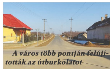
A város több pontján felújították az útburkolatot

Bűnmegelőzési programsorozat, szomszéd-figyelő rendszer kialakítása a rendőrség és a polgárőrség bevonásával, közlekedésbiztonság témájú rendezvények, a kerékpáros közlekedést népszerűsítő rendezvények.