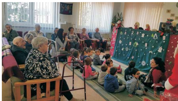
Télapó járt az időseknél

A gyerekek nagy örömeire idén is ellátogatott hozzánk a Mikulás, aki csomagjával minden mocorgóst megajándékozott. Mindenkit, mert Gyerekházunkba csak jó gyerekek járnak!