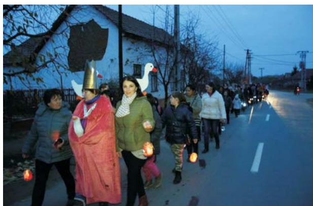
Mi kis falunk

A szervezők mindenkit szeretettel várnak.