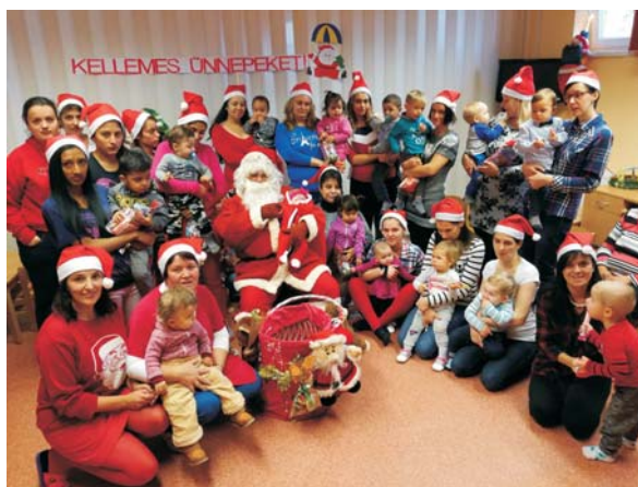
Mikulás a Mocorgóban

Egyesületünk közös ünnepeléssel köszöntötte advent első vasárnapját és meggyújtottuk a Városháza előtt elhelyezett adventi koszorún a Béke gyertyáját.