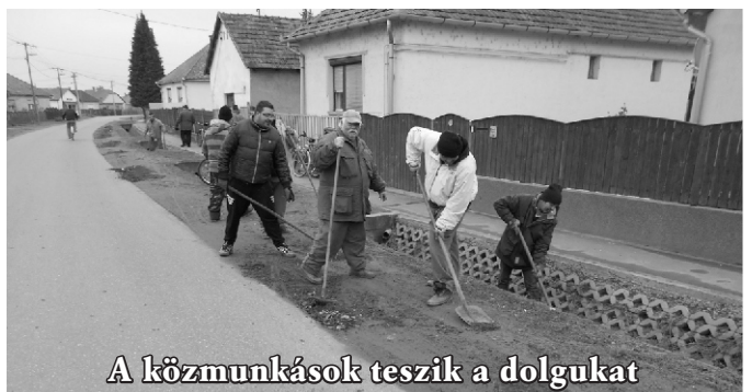
A közmunkások teszik a dolgukat