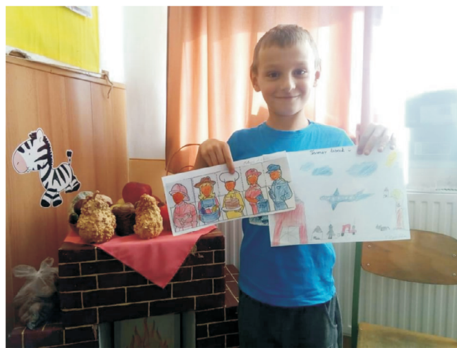
Pályorientációs nap az iskolában